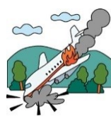
海外旅行中のケガ