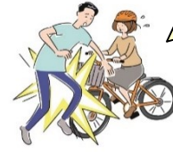
自転車で第三者に ケガを負わせてしまった