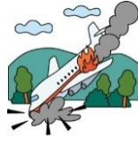
海外旅行中のケガ