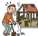
火災を起こし借家室を焼いてしまった