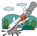
海外旅行先で遭難、 親族が駆け付けた