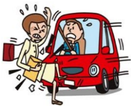
交通事故でのケガ