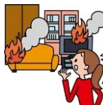
火災による家財の損害