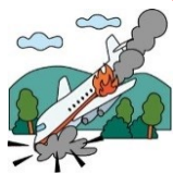
海外旅行中のケガ