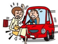
交通事故でのケガ