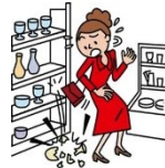
お店の商品を壊した