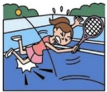
スポーツ中のケガ