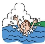
海で溺れて捜索して もらった