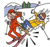
他人にケガを負わせた