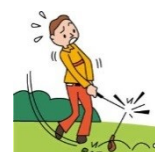
ゴルフクラブが折れた