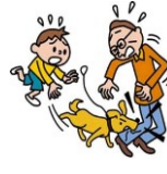
愛犬が他人に噛みついて ケガを負わせた