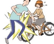
自転車で第三者に ケガを負わせてしまった