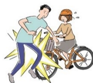
自転車で第三者に ケガを負わせてしまった

個人賠償責任補償をセットした場合、 日本国内で発生した事故については 損保ジャパンによる「示談交渉サービス」を ご利用いただけます。