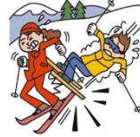
他人にケガを負わせた