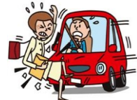
交通事故でのケガ