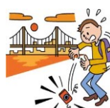
旅行中にカメラを壊した