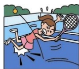
スポーツ中のケガ