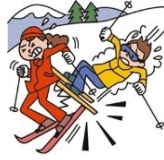
他人にケガを負わせた