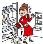
お店の商品を壊した