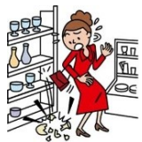
お店の商品を壊した