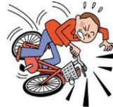
自転車で転倒してケガ(注)