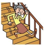
階段から落ちてケガ