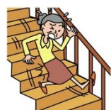
階段から落ちてケガ